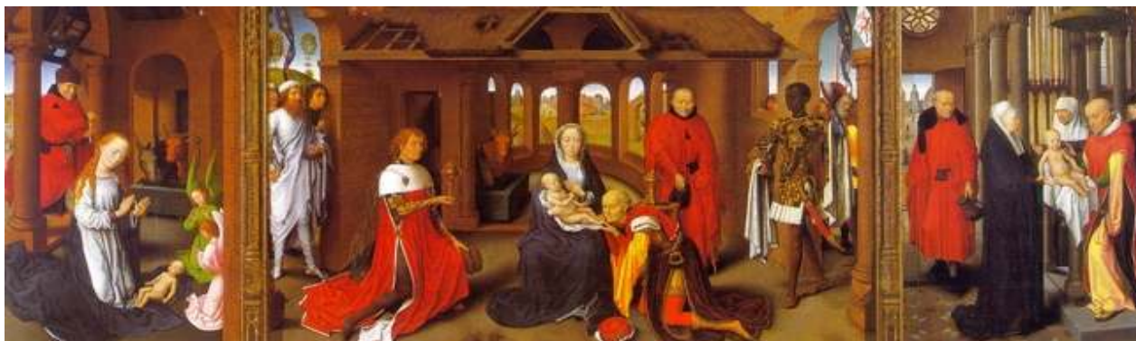
(Hans Memling, triptiek, 1470 – Prado Museum Madrid)